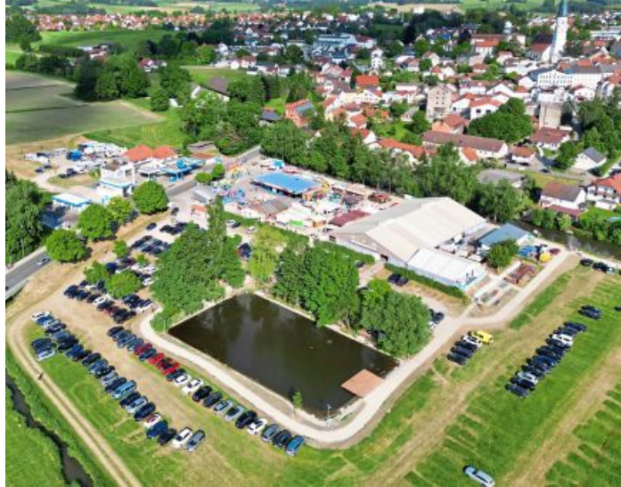
Der Volksfestplatz aus der Luft betrachtet.

Mit seinem vielseitigen Programm aus Tradition, Musik, Brauchtum, Familienangeboten und Festzeltabenden verspricht das 63. Veldener Volksfest erneut ein Treffpunkt für die gesamte Region zu werden. Zwischen Frühschoppen, Blasmusik, Partybands und Pferderennen zeigt sich Velden dabei einmal mehr als Gastgeber eines Volksfestes, das generationsübergreifend die Menschen zusammenbringt. Weitere Infos unter www.volksfest-velden.de