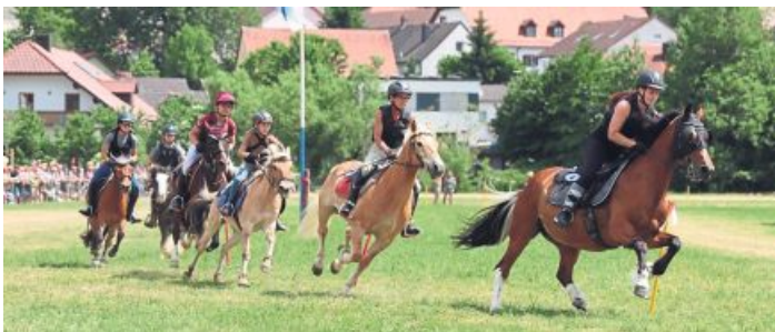
Auch die jungen Reiter sind ganz vorne dabei.

Der Pferde- und Rennsportverein Velden pflegt die Veranstaltung mit großem Engagement und viel Liebe zum Detail. Zahlreiche Helfer sorgen auch hier dafür, dass der Ablauf reibungslos funktioniert und die Besucher einen unterhaltsamen