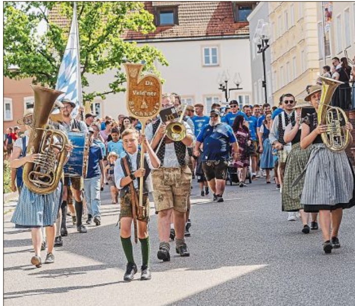
Beim Auszug zum Festplatz sind alle dabei.

Zahlreiche Musikgruppen, Vereine und Mitwirkende sorgen an allen Tagen für Leben im Festzelt und auf dem Volksfestgelände. Tischreservierungen sind an mehreren Abenden möglich und sind bereits im Vorfeld stark nachgefragt. Am ersten Freitag ist bereits ab 16