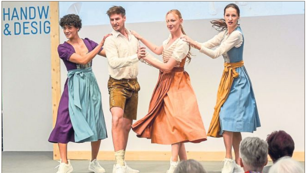
Trachtentrends 2026 für Sie und Ihn auf der Internationalen Handwerksmesse

Der Wunsch nach Qualität und Nachhaltigkeit spiegelt sich in der Wahl der Stoffe ebenso wider, wie die Betonung von Eleganz und Stil. Während Samt festlichen Anlässen elegante Tiefe verleiht, besticht Feincord durch eine weiche Struktur und angenehme Haptik. Naturmaterialien wie Baumwolle und Leinen sind auf dem Vormarsch. Strukturierte Jacquardstoffe ergänzen das Sortiment. Doch nicht nur das Dirndl selbst, auch die Bluse wird zum Hingucker. Nach dem Motto „erlaubt ist, was gefällt“,