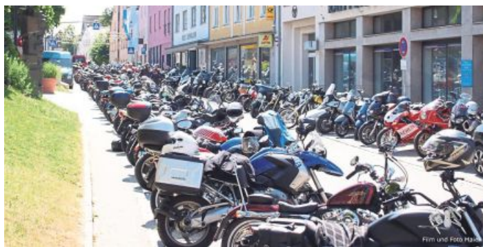
Ein beeindruckender Anblick kurz vor der Segnung.

Die Motorradsegnung des Motorradclubs MCV ist seit mehr als zehn Jahren fester Bestandteil des Volksfestprogramms und hat sich zum beliebten Treffpunkt für Biker, Familien und Besucher entwickelt.