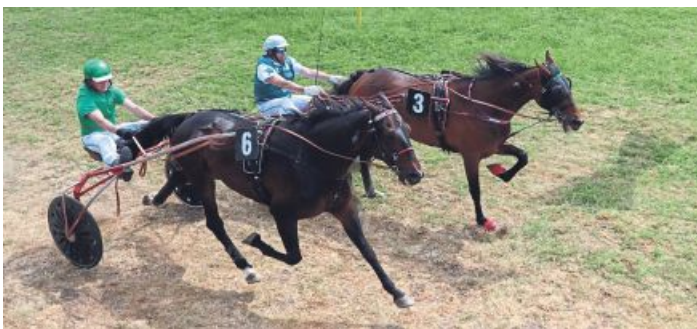
Ein Duell geprägt von Eleganz und Schnelligkeit.

Die Besucher erwartet auch in diesem Jahr ein abwechslungsreiches Rennprogramm mit packenden Duellen und